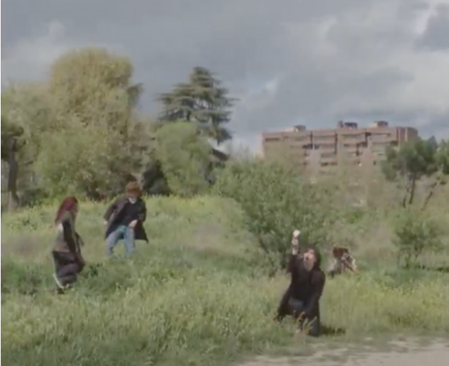
Movilidades en una ciudad permeable a los ecosistemas

Ingeniera civil con especialización en urbanismo y desarrollo territorial, formada en la Universidad Politécnica de Madrid y la Bartlett School de Londres. Ha trabajado en cooperación internacional con organismos como UN Habitat y la Comisión Europea. Actualmente, está realizando un doctorado en la Facultad de Arquitectura de Madrid, investigando el diseño de paisajes influenciado por la feminidad cotidiana.